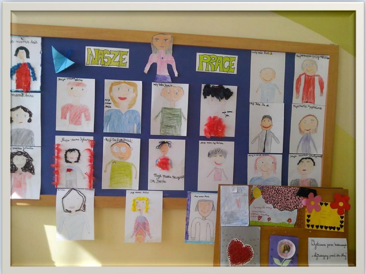
Portrety mamy i taty w wykonaniu Świetlików ☺