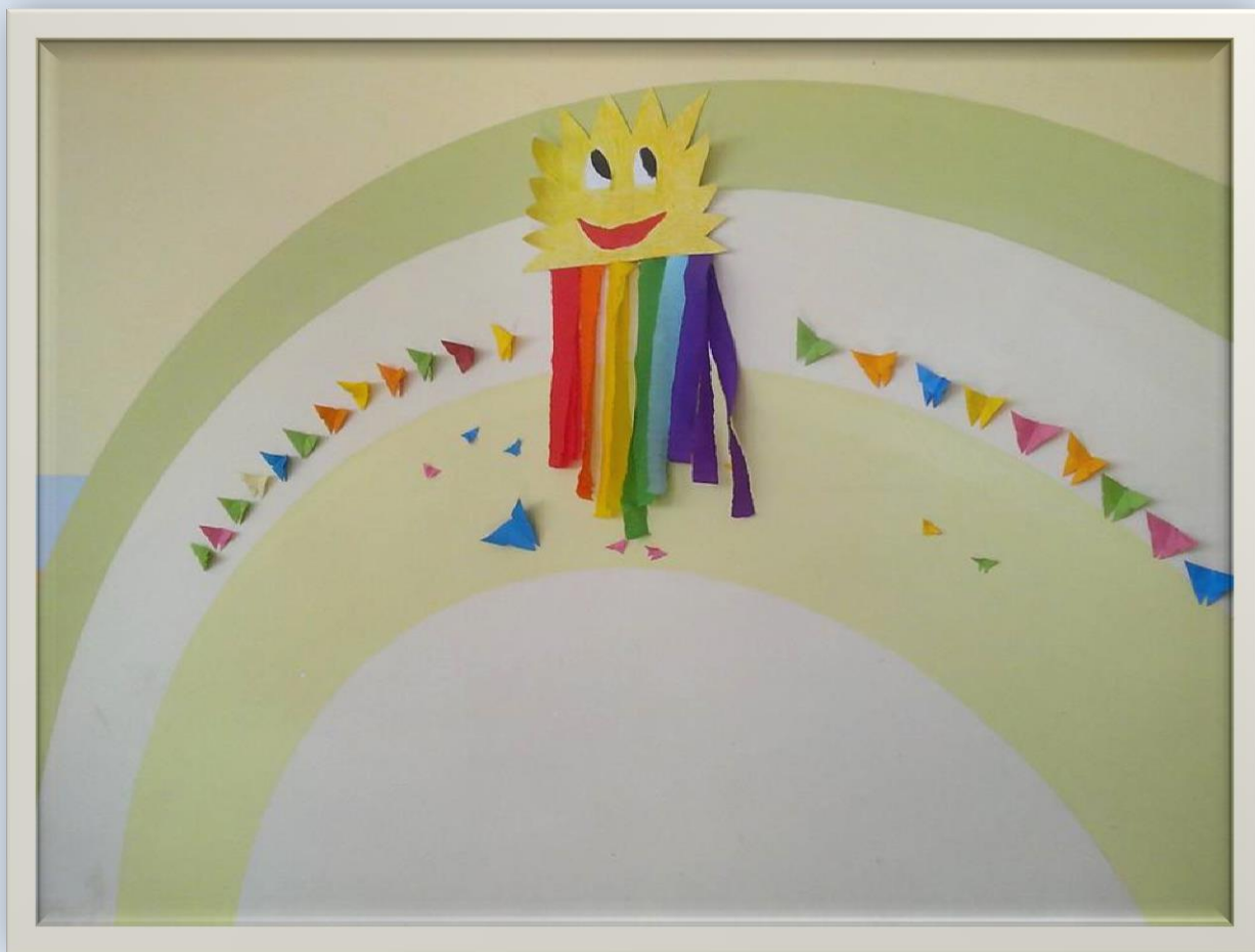
Tęczowe słoneczko w towarzystwie motylków