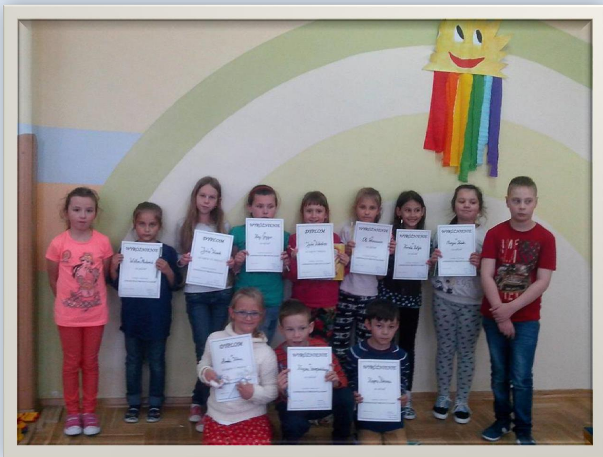
Uczestnicy i organizatorzy konkursu pt. „Najpiękniejszy prezent dla Mamy”